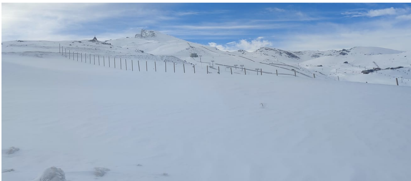
Del Veleta al Caballo 11-3-25