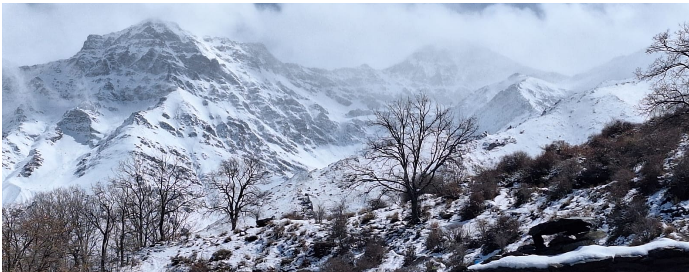
Cabecera río Genil 11-3-25